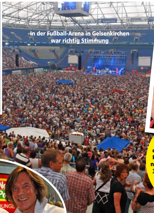
In der Fußball-Arena in Gelsenkirchen war richtig Stimmung