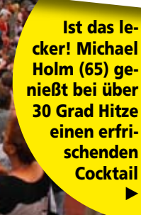
Ist das lecker! Michael Holm (65) genießt bei über 30 Grad Hitze einen erfrischenden Cocktail