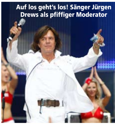
Auf los geht's los! Sänger Jürgen Drews als pffiffiger Moderator